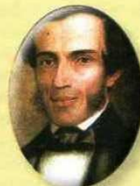
Rufino Cuervo 1847