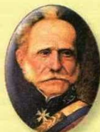
Tomás Cipriano de Mosquera 1845 - 1849, 1861 - 1863 1864, 1866 - 1867