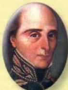
Rafael Urdaneta 1830 - 1831