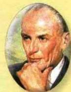
Alberto Lleras Camargo 1945 - 1946, 1958 - 1962