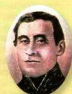
José M. Melo 1854