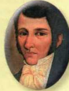
José Fernández Madrid 1814 y 1816