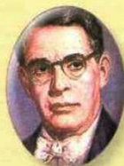
Eduardo Santos Montejó 1938 - 1942