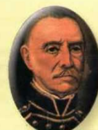
Pedro Alcántara Herrán 1841 - 1845