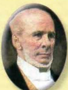
Francisco Javier Zaldúa 1882