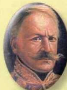
José M. Obando 1831 - 1832