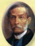
Manuel Murillo Toro 1864 - 1866, 1872 - 1874