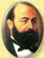
Santiago Pérez 1874 - 1876