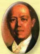
Enrique Olaya Herrera 1930 - 1934