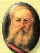
José Hilario López 1849 - 1853, 1863