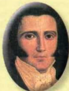
Joaquín Mosquera 1830