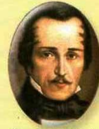
Francisco de Paula Santander 1819 - 1826, 1832 - 1837