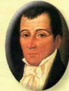
Joaquín Camacho 1814