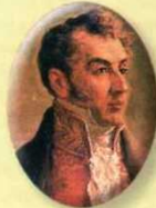
Antonio Nariño 1811 - 1812