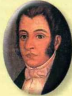
Jorge Tadeo Lozano 1811