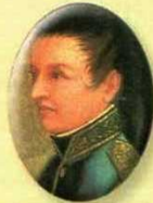
Custodio García Roviera 1814 y 1815