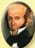
Juan de Dios Aranzazu 1841