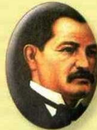
Sergio Camargo 1877