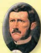
Santos Acosta 1867 - 1868