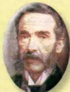
Froilán Largacha 1863