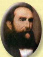
Rafael Núñez 1880 - 1882, 1884 - 1886 1887, 1888