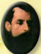
Eustorgio Salgar 1870 - 1872