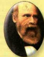
Aquileo Parra 1876 - 1877