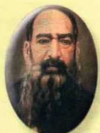
Ezequiel Hurtado 1884