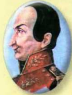
José Miguel Pey 1810