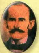
José M. Campo Serrano 1886 - 1887