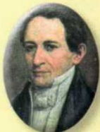
Domingo de Caycedo 1830, 1831, 1841, 1842