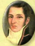
Manuel Rodríguez Torices 1815