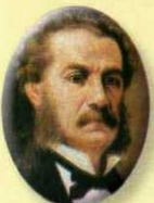
Julián Trujillo 1878 - 1880