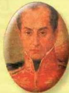
Simón Bolívar 1819 - 1830