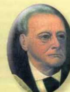
José Ignacio Márquez 1832 y 1837 - 1841