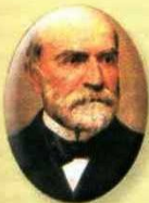
Salvador Camacho Roldán 1868 - 1869