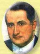
Darío Echandía 1943 y 1944